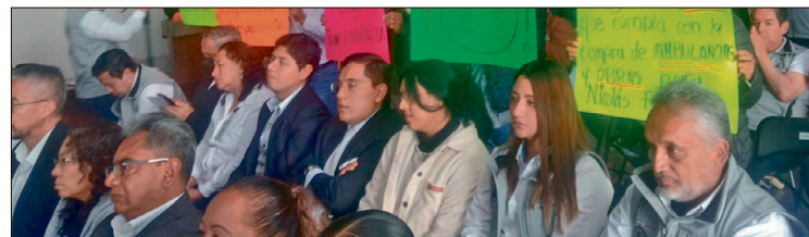
▲ Inconformes señalan que los fondos federales no se han administrado de manera equitativa entre las comunidades.

de manera correcta y con transparencia, “que este recurso beneficie a la población de mi localidad, pedimos pavimentación de concreto hidráulico, que se construyera una delegación (...), que todos los