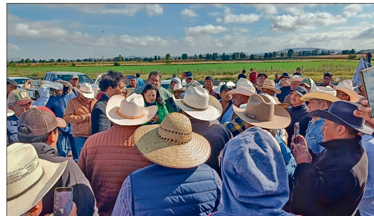
▲ Demandan que el gobierno de México otorgue precio de garantía por tonelada de maíz de 7 mil 500 pesos.