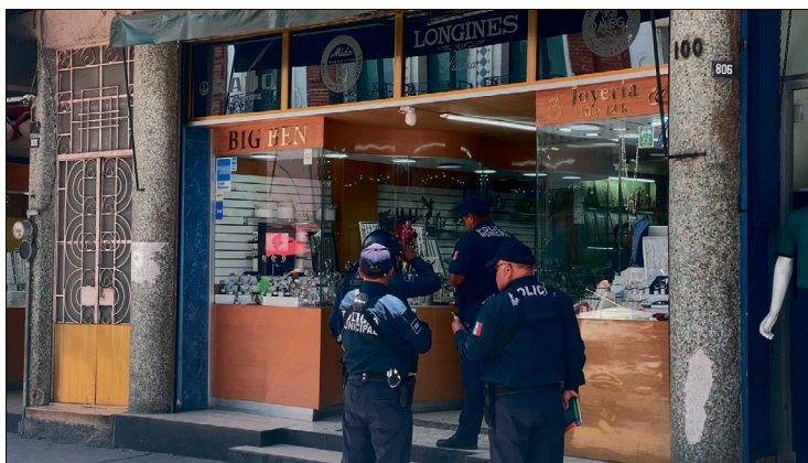
▲ En julio pasado la joyería Big Ben también fue víctima de robo.

El presidente municipal señaló que el establecimiento ya había