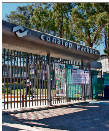
▲ Las actividades académicas en varios planteles permanecen suspendidas.

Según explicaron, la falta de base laboral es una situación que ha