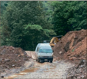
▲ Se han denunciado aumentos injustificados, llegando incluso al doble de la tarifa normal.

“Es responsabilidad de las autoridades vigilar su cumplimiento y evitar abusos en perjuicio de la población”, mencionó, al referir que quienes se han visto más afectados son trabajadores y estudiantes, quienes además de enfrentarse a