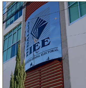
▲ En el caso de Hidalgo, el proyecto contiene nueve perfiles de los mejores evaluados para ocupar las consejerías del IEEH.

A pesar de ello, se aprobó por unanimidad el proyecto de acuerdo que, en el caso de Hidalgo, contiene nueve perfiles de los mejores evaluados en la etapa de selección y será el Consejo General del Instituto Nacional Electoral quien vote a más tardar el 31 de octubre a las personas