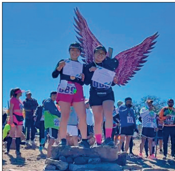
▲ Este evento combina tradiciones religiosas y actividades culturales.

El miércoles 12 de febrero realizarán actividades religiosas y culturales que fortalecen las tradiciones del municipio. Por la mañana, a las 08:00 horas, llevarán a cabo la procesión desde la Parroquia Divino Salvador.