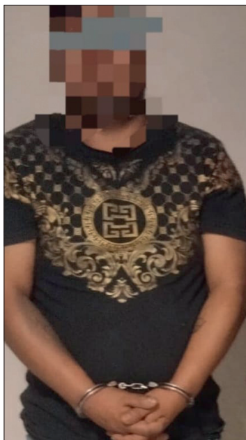
▲ La víctima denunció que el hombre la había agredido y amenazado dentro de su domicilio.

El detenido quedó a disposición del Ministerio Público, donde se determinará su situación legal.