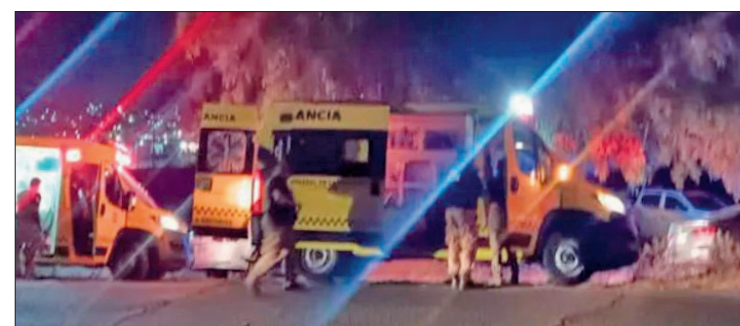
▲ En las últimas dos semanas, Mineral de la Reforma registró diversos actos violentos.

Francisco Fernández Hasbun destacó que el Ministerio Público ha actuado de manera diligente en este caso y otros recientes, y señaló que hay evidencia sólida. Asimismo, pidió paciencia a la ciudadanía, pues aseguró que las investigaciones están avanzadas y que pronto se presentarán resultados.