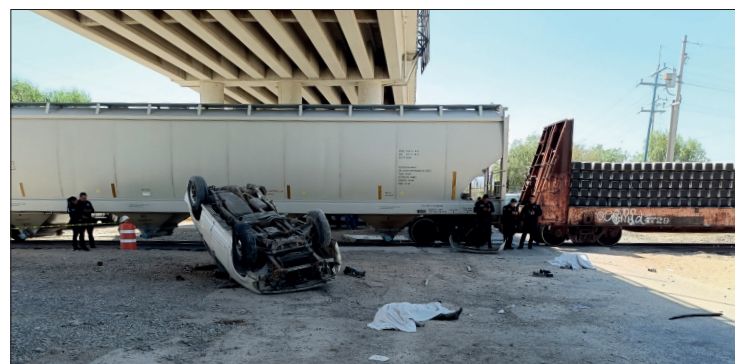
▲ Una camioneta Ford Explorer circulaba con dirección a Tlahuelilpan, cuando el tren le golpeó de costado.

Una mujer de iniciales P.O., originaria de Nopala, fue trasladada al Hospital General de Tula