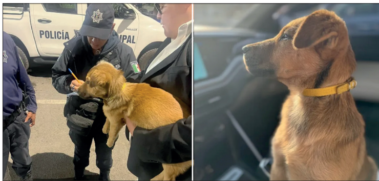
▲ Oficiales de seguridad pública resguardaron al animal para su protección.

Por otro lado, se valorará la situación legal y social del presunto agresor, debido a las condiciones de vulnerabilidad con las que cuenta.