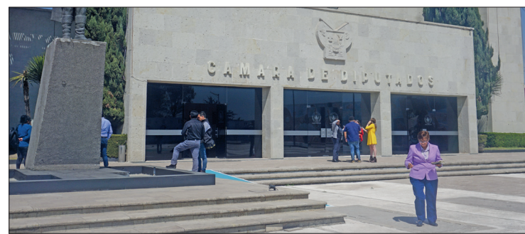
▲ Las cotizaciones van desde 58 mil pesos hasta más de un millón de pesos.

se licitó este servicio en tres ocasiones, pero en todas ellas se declararon desiertos los procesos por