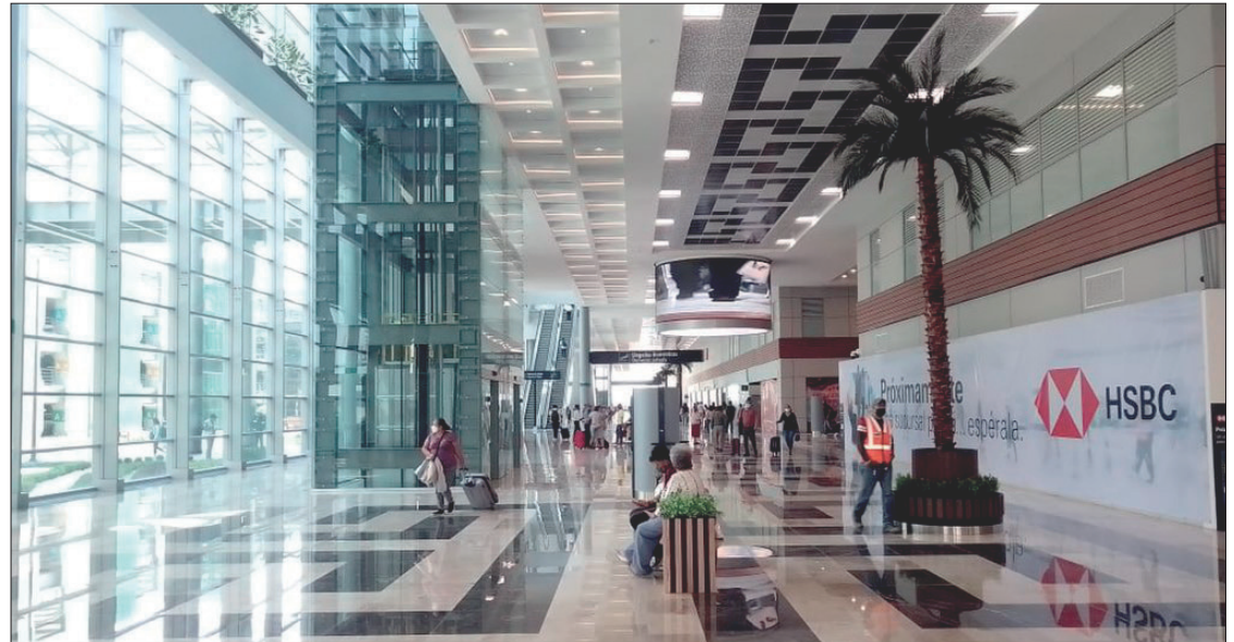
▲ De acuerdo con Alejandro Sánchez Ramírez, hay diferentes empresas especializadas para participar en la construcción de terraplenes, las vías del tren, carriles, durmientes, y aspectos similares.

vías del tren, carriles, durmientes, y aspectos similares, aunque también podrían suministrarse los vagones del tren.