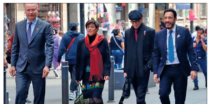
▲ Los exgobernadores Omar Fayad y Quirino Ordaz, actualmente embajadores de México en Noruega y España, respectivamente, acudieron a Palacio Nacional a una reunión con la presidenta Claudia Sheinbaum. El encuentro, parte de una cita regular de embajadores y cónsules, generó especulaciones sobre sus posibles repercusiones en la política mexicana.