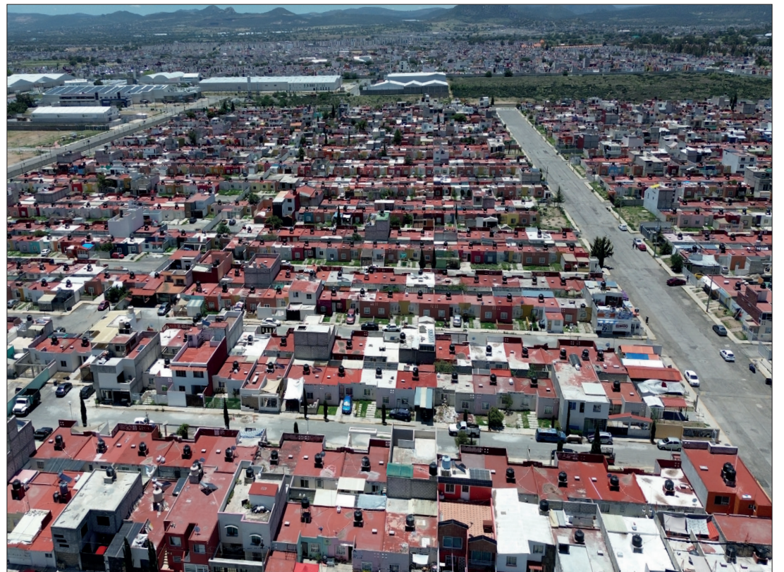
▲ En Hidalgo la regularización lleva un avance con mil 300 lotes potenciales revisados.

En la entidad van mil 300 lotes potenciales revisados de los 6 mil 450 propuestos para el objetivo