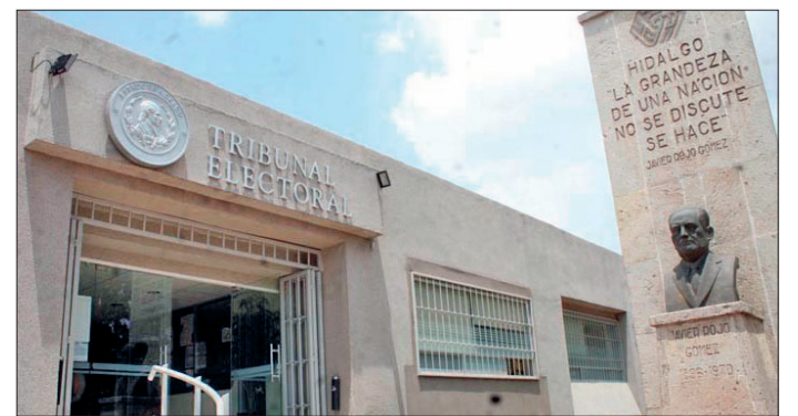
▲ A finales del año pasado, el Tribunal Electoral de Hidalgo adquirió seis unidades nuevas.

Cabe recordar que, además de estas erogaciones, a finales del año pasado el Tribunal Electoral de Hidalgo adquirió seis unidades nuevas, de las cuales cuatro son vehículos y dos camionetas, por un monto de 2 millones 966 mil 324 pesos adquiridas con las empresas Herrera Motors y Distribuidora Volkswagen.