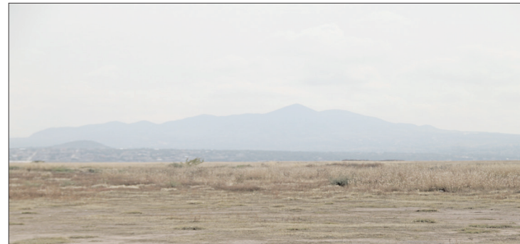
▲ Anormalmente seco es la condición de sequedad que se presenta al inicio o al final de un periodo de sequía.

El informe federal añade que, en la segunda quincena de diciembre de 2024, las lluvias por arriba del