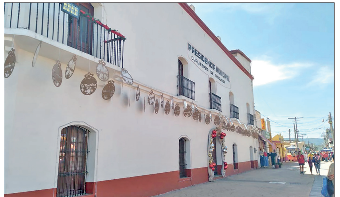
▲ El periodo de gobierno comprenderá del 15 de enero de 2025 al 4 de septiembre de 2027.

Los inconformes refutaron el registro de candidatura otorgada el 11 de noviembre de 2024