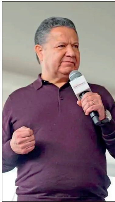
▲ El gobernador acudió, en al menos cinco ocasiones, a Palacio Nacional para sostener reuniones de trabajo.

Principalmente, sobre el Plan Nacional Hídrico, en donde estuvo acompañado por funcionarios de la Comisión de Agua y Alcantarillado de Sistemas Inter Municipales (Caasim), de la Comisión Estatal de Agua y Alcantarillado (CEAA) y de la Secretaría de Infraestructura Pública y Desarrollo Urbano Sostenible (Sipdus).