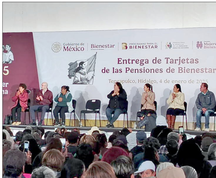
▲ La presidenta visitó el municipio de Tepeapulco para la entrega de tarjetas de programas de Bienestar.

go, el campo y todo lo que se requiere (...) Toda la basura de la zona se va a recolectar y se va a tener una planta de tratamiento de basura. (Tula) va a ser la ciudad más limpia y con mejor