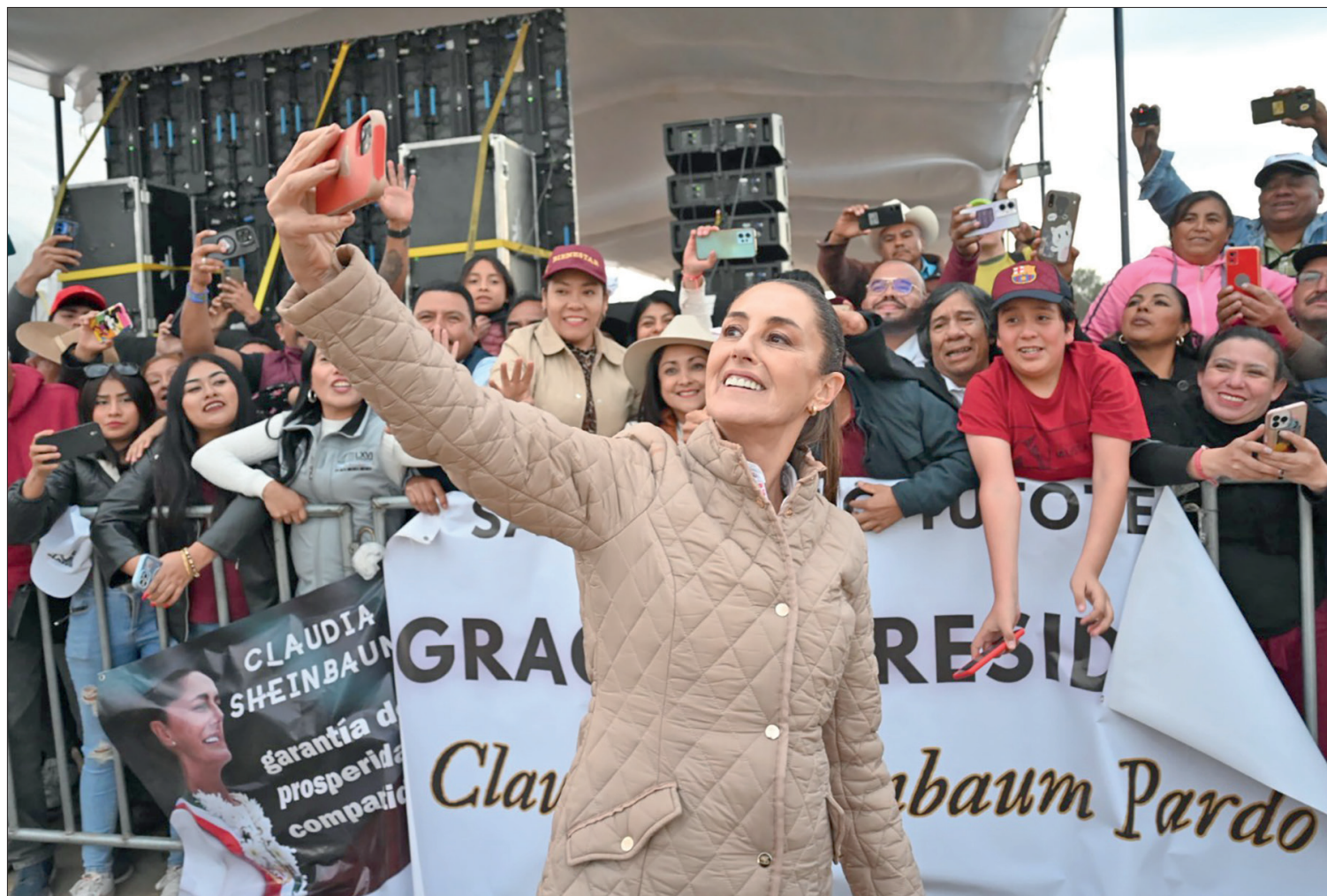
▲ La mandataria visitó el municipio de Tepeapulco para la entrega de tarjetas de programas de Bienestar.