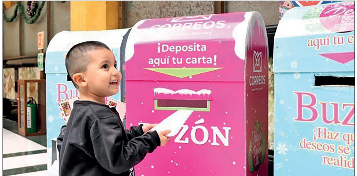
▲ Las cartas las pueden enviar desde el Palacio Postal y desde cualquier oficina de Correos de México en el país.

convierte así en un punto de encuentro donde la ilusión, la creatividad y la tradición se entrelazan, ofreciendo a la niñez la oportunidad de hacer llegar sus deseos a los personajes más queridos de esta temporada.