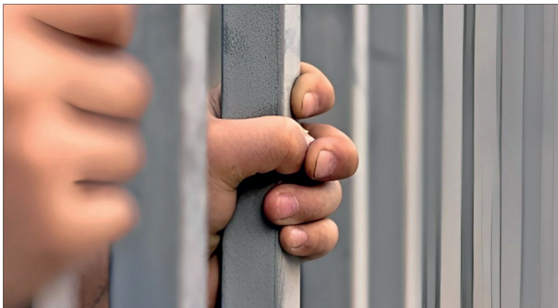
▲ La notificación de derechos a las personas detenidas es un componente clave para garantizar la transparencia.

En municipios como Pachuca, Nopala, Tenango de Doria, Francisco I.