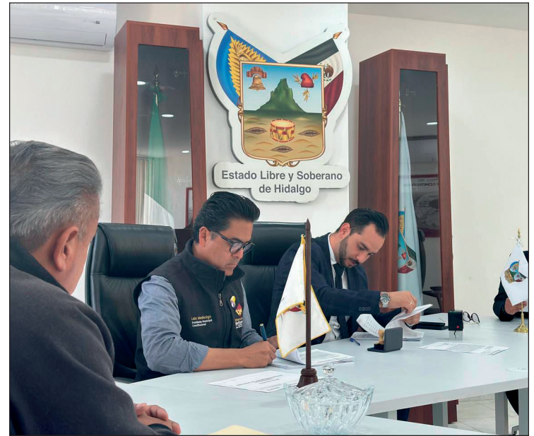
▲Entre las principales observaciones destacan pagos improcedentes por concepto de dietas extraordinarias y aguinaldos a síndicos y regidores por 10 millones 658 mil 955 de pesos.

De acuerdo con la administración actual, el Comité de Transición detectó un total de 19 observaciones financieras y administrativas en el gobierno municipal anterior, además de 28 irregularidades relacionadas con bienes