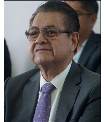
▲ Olivares precisó que, gracias a su estilo de vida saludable, el mandatario retomó rápidamente sus actividades.

Por otra parte, el funcionario expresó que, en términos generales, el estado de Hidalgo se en-