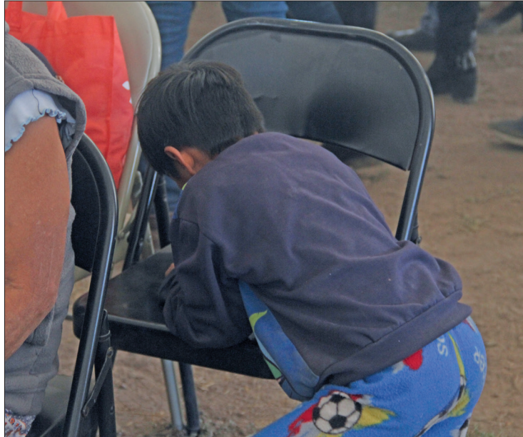
▲ En 112 casos las víctimas fueron menores de edad y en 95 fueron presos recluidos en Ceresos.

Asimismo, los resultados refieren que, de las 770 quejas analizadas, 76 fueron abiertas de oficio al considerar la comisión que era evidente la violación a derechos humanos; mientras que en 50 casos se declaró incompetente y 380 quedaron pendientes, toda vez que presentaban imprecisiones o no reunían los requisitos legales o reglamentarios, siendo imposible que la omisión fuera subsanada.