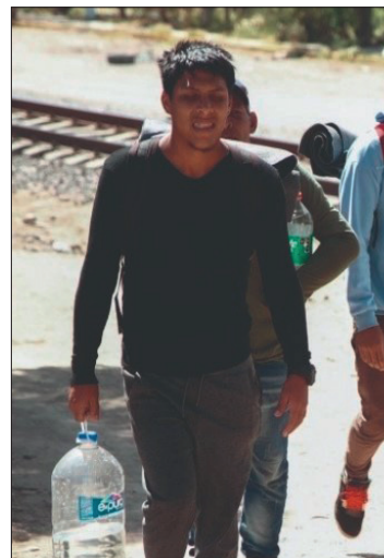
◀ De las más de mil 800 personas atendidas, la autoridad migratoria solo regresó a ocho.

Los municipios con más personas localizadas durante el año fueron Chapulhuacán, Tizayuca y Pachuca