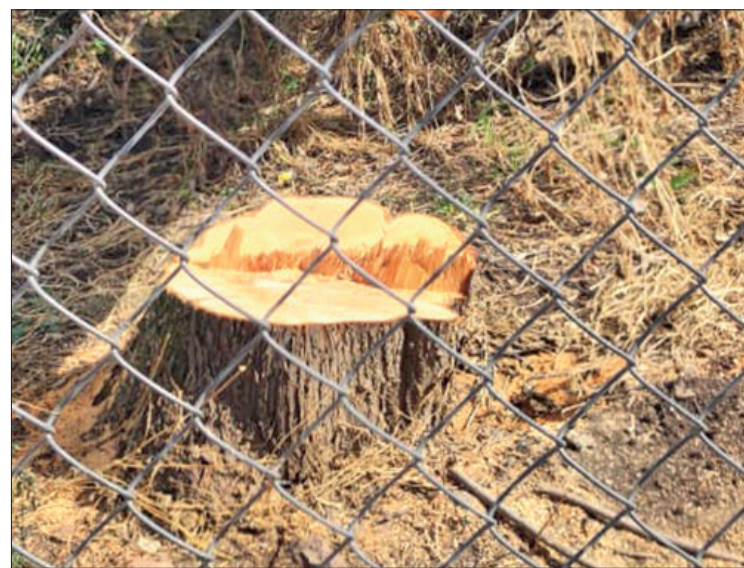
▲ La dirección de Medio Ambiente municipal autorizó el derribo de árboles de más de 50 años.

Cabe mencionar que, aunque el permiso de derribo de árboles, otorgado a un particular, fue mostrado a la ciudadanía inconforme el día de la manifestación, los ciudadanos aseguraron que los árboles derribados estaban en vía pública y no correspondían a la altura y diámetro que la autorización específica.